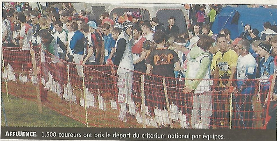
AFFLUENCE. 1.500 coureurs ont pris le départ du criterium national par équipes.

La station de ski a connu une énorme affluence, dimanche 25 octobre, à l'occasion du championnat de France de course d'orientation organisé par l'association Nose (Nature orientation Saint-Étienne). 1.500 concurrents ont pris le départ du criterium national par équipes.